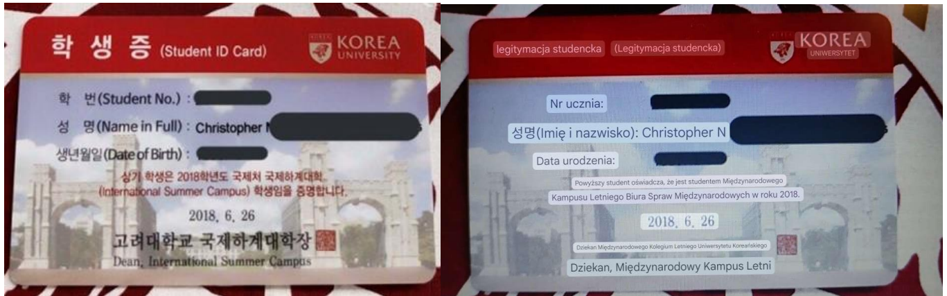
Zdjęcie 3 Karty studenta Uniwersytetu Koreańskiego (wersja oryginalna oraz przetłumaczona przy użyciu gogle lens)