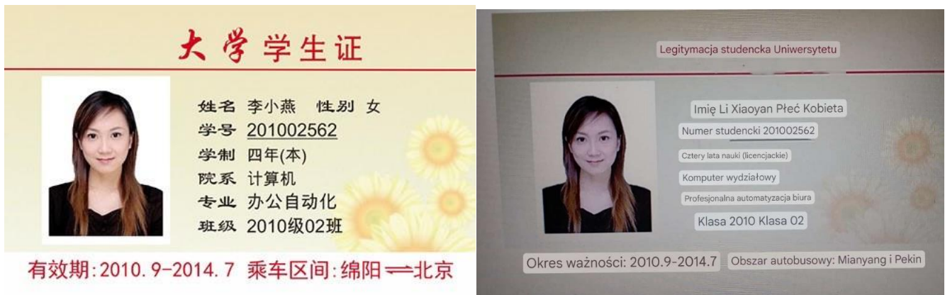
Zdjęcie 4 Legitymacja studencka Uniwersytetu Sichuan (wersja oryginalna oraz przetłumaczona przy użyciu gogle lens)