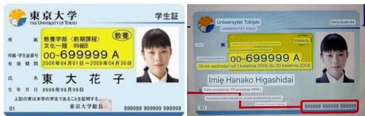
Zdjęcie 1 Legitymacja studencka uniwersytetu tokijskiego (wersja oryginalna oraz przetłumaczona przy użyciu gogle lens)

Wszystkie wymienione legitymacje, poza legitymacją Uniwersytetu Sichuan, są plastikowymi blankietami. Legitymacja wspomnianego uniwersytetu jest papierowym blankietem umieszczonym wewnątrz tagiem RFID.