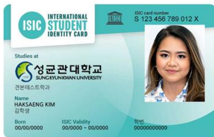
Zdjęcie 7 Przykładowa legitymacja międzynarodowa

Wyjątkiem są tzw. legitymacje międzynarodowe ISIC (ang. International Student Identity Card). ISIC to międzynarodowy standard identyfikacji dla studentów, który jest akceptowany w wielu krajach na całym świecie, w tym również w Azji. Legitymacja ISIC oferuje studentom różnorodne korzyści, takie jak zniżki na bilety lotnicze, noclegi, atrakcje turystyczne, zakupy i inne usługi.