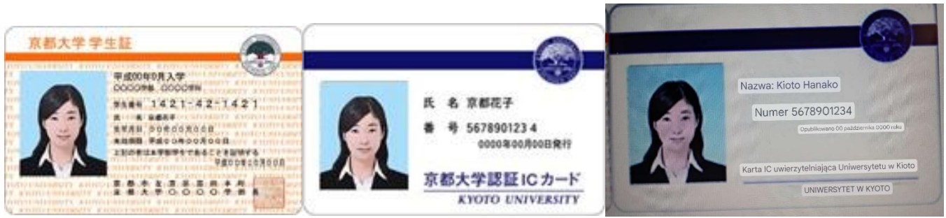
Zdjęcie 2 Legitymacja studencka uniwersytetu w Kioto (starsza wersja bez chipa i nowsza wersja z chipem) (wersja oryginalna oraz przetłumaczona przy użyciu gogle lens)