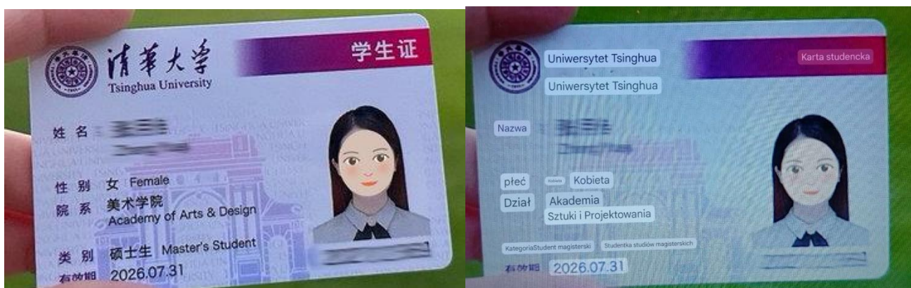
Zdjęcie 6 Legitymacja studencka Uniwersytetu Tsinghua (wersja oryginalna oraz przetłumaczona przy użyciu gogle lens)