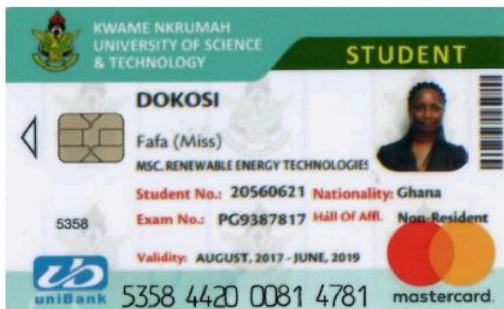
Obraz 1. Kwame Nkrumah University of Science and Technology w Ghanie