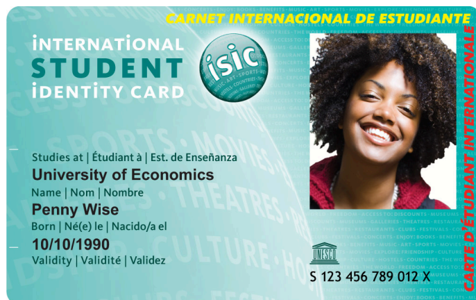
Obraz 4. Przykładowa karta ISIC

Karty studenta wydane w jednym kraju afrykańskim zazwyczaj są ważne i uznawane tylko w ramach tego państwa, chyba że istnieją specjalne porozumienia międzynarodowe. To ograniczenie terytorialne wynika z różnorodności systemów edukacyjnych i regulacji prawnych na kontynencie. Niemniej jednak, niektóre uniwersytety mogą prowadzić programy wymiany studenckiej lub współpracy, które umożliwiają używanie kart studenta w szerszym kontekście międzynarodowym - chociażby program wymiany erasmus. Kraje afrykańskie często korzystają też z uniwersalnej karty ISIC - International Student Identity Card, która działa w większości krajów na świecie.