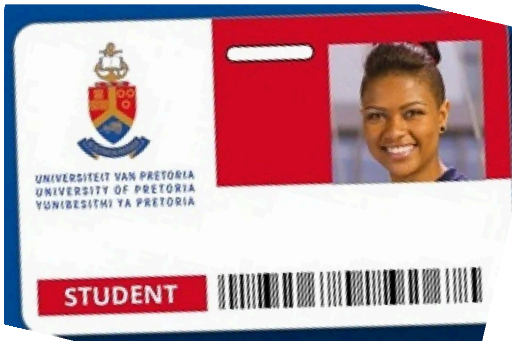
Obraz 3. University of Van Pretoria