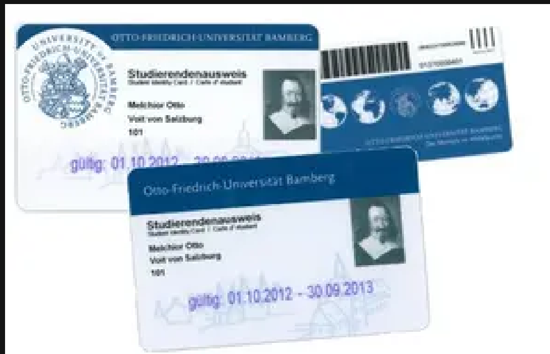
STUDENT ID CARD