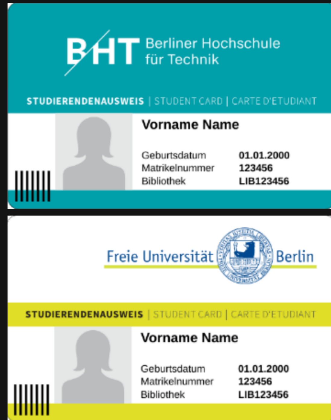
KARTY WYDAWANE PO 2016