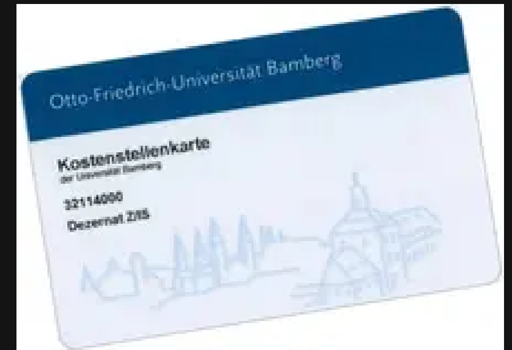
COST CENTRE CARD