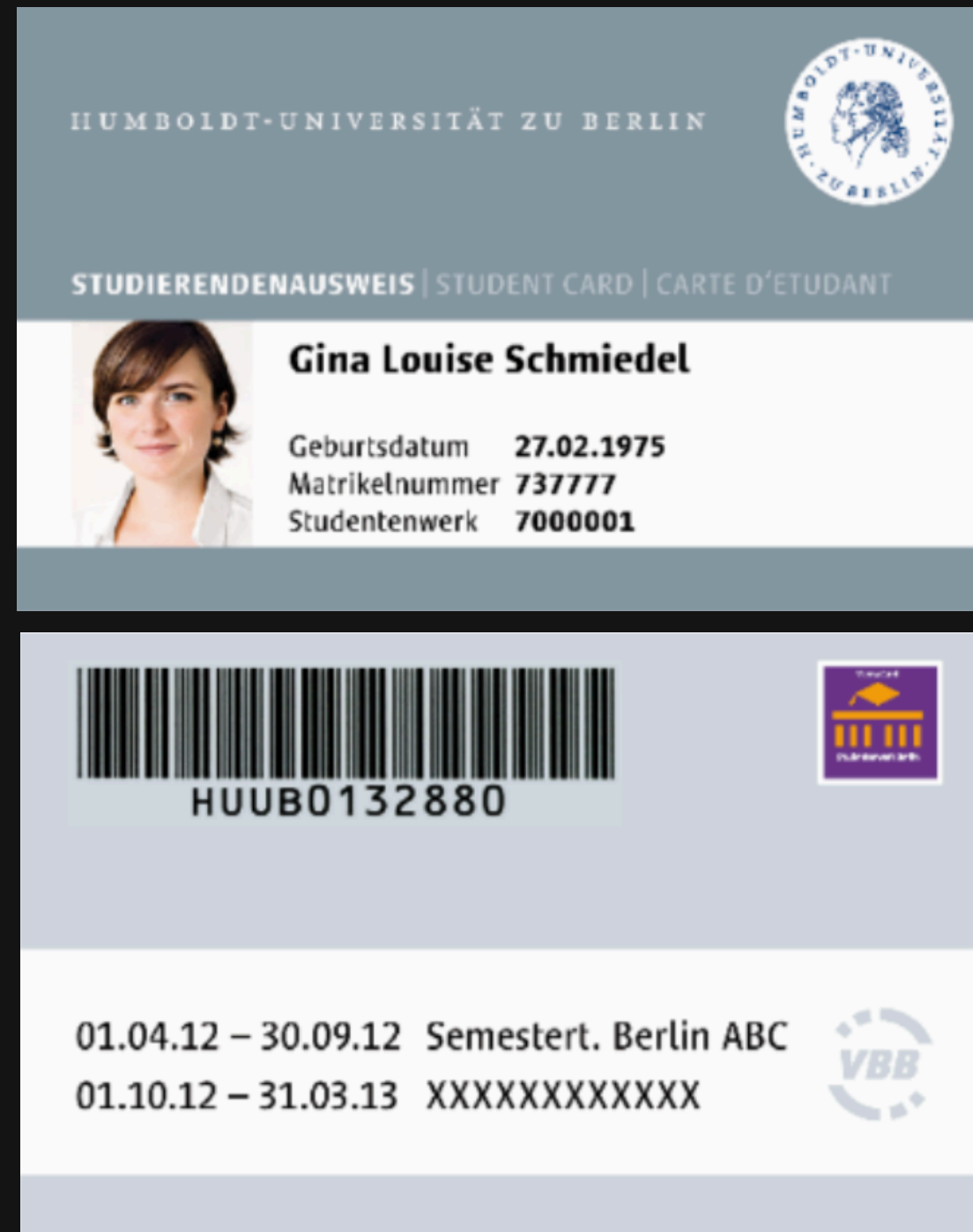
KARTY WYDAWANE DO 2016